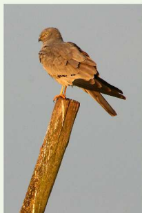
Le Busard cendré