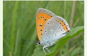
Le Cuivré des marais