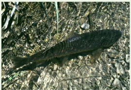
La Truite fario