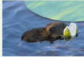
Le Campagnol amphibie