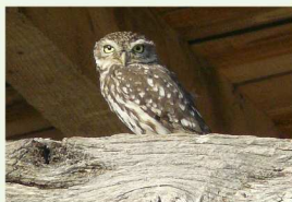
La Chevêche d'Athéna