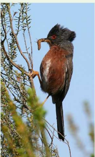
La Fauvette pitchou