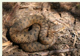
La Vipère aspic