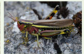
Le Criquet ensanglanté