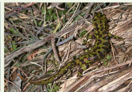
Le Triton marbré