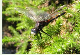
La Leucorrhine à gros thorax