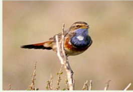
La Gorgebleue à miroir