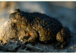
Le Sonneur à ventre jaune