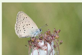
L'Azuré des Mouillères