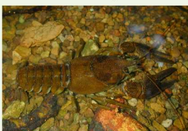
L'Ecrevisse à pattes blanches