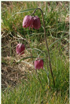
La Fritillaire pintade