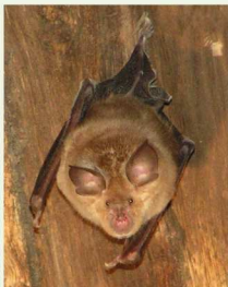
Le Grand Rhinolophe