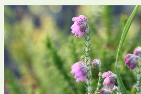
La Bruyère à quatre angles