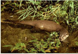
La Loutre d'Europe