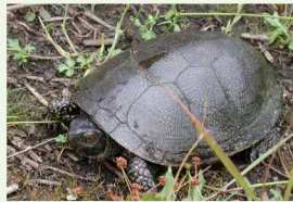
La Cistude d'Europe